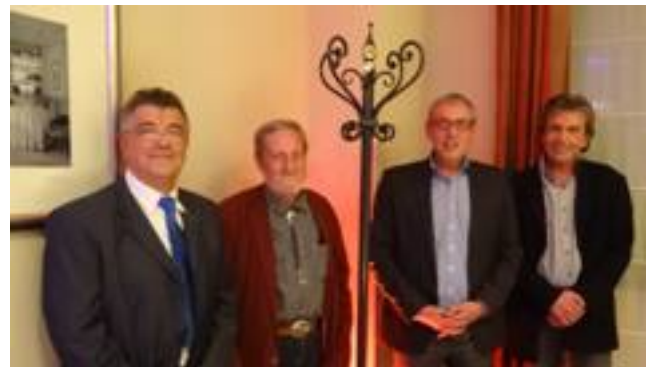
■ Les présidents du Lions club et de l'ALCR aux côtés du directeur et du responsable pédagogique de l'école Boisard, pour une remise très officielle du portemanteau.

À la fois objet symbolique et utilitaire, un superbe portemanteau en fer forgé a été officiellement offert, mardi, au président de l'ALCR de la rue Hénon, par le président du Lions club Lyon nord.