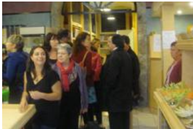
■ Inauguration de l'épicerie à l'espace réaménagé, rue des Capucins.

Une épicerie au fort brassage social de ses membres, comprenant des adhérents et bénéficiaires. Chacun paye les produits selon ses revenus, afin de favoriser le non-assistanat. L'association propose aussi à ses adhérents des ateliers d'information et de sensibilisation sur de grands thèmes comme la nutrition, la santé, la citoyenneté... La structure participe également au